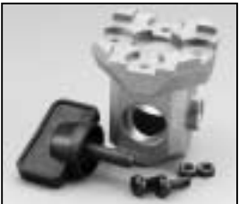
L4.77145.E 16 mm stirrup socket Hülse für Bügel