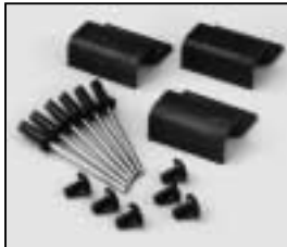
L4.79240.E Set of accessory brackets Set Torhalter