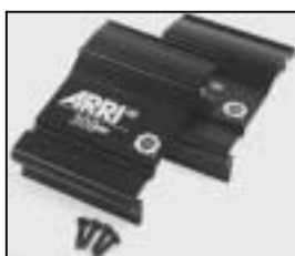
L4.79247NE Set of side panels (USA) NRTL (from ser.no.6331) black Set Seitenbleche (USA) NRTL (ab Ser.Nr.6331) schwarz