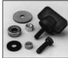
L4.79435.E Mounting set for stirrup Bügelbefestigungssatz