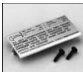
L4.79212.E Bottom plate silver Bodenblech silber