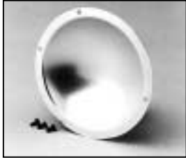
L4.79237.E Reflector Reflektor