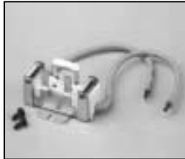
L4.79326.E Lampholder Lampenfassung