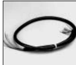
L4.79274.E Head to switch cable Kabel (bis zum Schalter)