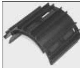
L4.79219XE Top cover cpl. black Deckel kpl. schwarz