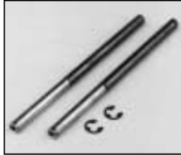
L4.79214.E Focus support rods Gleitstange