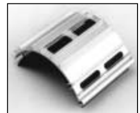
L4.79219.E Top cover cpl. silver Deckel kpl. silber