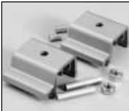
L4.79420.E Stirrup bracket set silver Bügelhalter Set silber