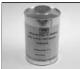
L4.70186.E Paint thinner Farb-Verdünnung