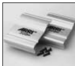
L4.79246UE Set of side panels (USA) ETL (to ser.no.6330) silver Set Seitenbleche (USA) ETL (bis Ser.Nr.6330) silber