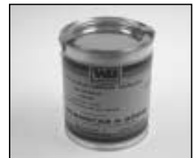
L4.70183.E Paint black similar RAL 9011 Lack schwarz ähnlich RAL 9011