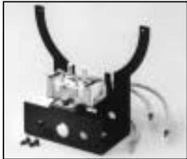
L4.79253.E Lampholder + lamp carriage compl. Lampenfassung + Fassungsträger kpl.