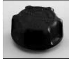
L4.79036.E Focus knob Fokusknopf