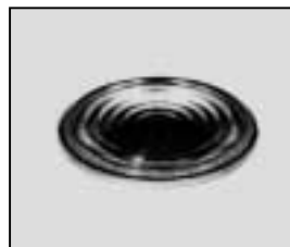
L4.79207.E Fresnel lens Stufenlinse