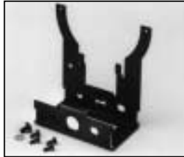
L4.79325.E Lamp carriage Fassungsträger