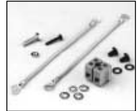
L4.79434UE Terminal block ceramic Kabelklemme Keramik