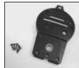
L4.79210XE Rear casting black Rückteil schwarz