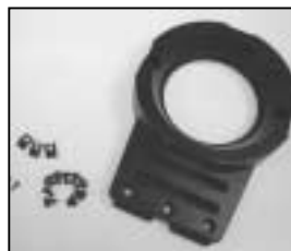
L4.79208XE Front casting black Frontteil blau schwarz