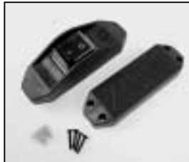
L4.77157.E Inline switch complete 110–240 V Schnurschalter komplett