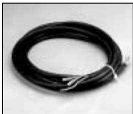
L4.79228.E Mains cable Netzkabel