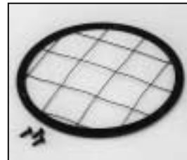
L4.79168.E Wire guard Schutzgitter