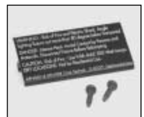
L4.79213UE Bottom plate (USA) black Bodenblech (USA) schwarz