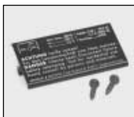
L4.79213.E Bottom plate black Bodenblech schwarz