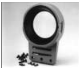
L4.79208.E Front casting blue Frontteil blau

NOTE: WHEN ORDERING QUOTE PART NUMBER BEMERKUNG: BEI BESTELLUNG IDENT.-NR. ANGEBEN