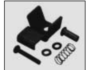
L4.79244.E Top latch Verschlussklaue