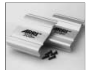
L4.79246NE Set of side panels (USA) NRTL (from ser.no.6331) silver Set Seitenbleche (USA) NRTL (ab Ser.Nr.6331) silber