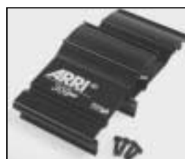
L4.79247.E Set of side panels black Set Seitenbleche schwarz