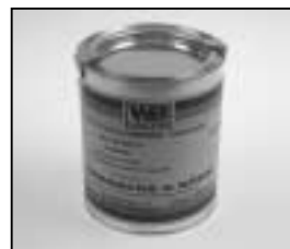
L4.70194.E Paint blue similar RAL 5015 Lack blau ähnlich RAL 5015