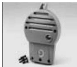
L4.79210.E Rear casting blue Rückteil blau