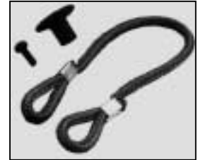
L4.79242.E Cable tie set Halteleine Set