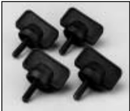
L4.79436.E Set of locking knobs Satz Arretierschrauben