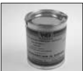
L4.70189.E Paint silver metallic similar RAL 9006 Lack silber metallic ähnlich RAL 9006