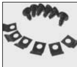
L4.79056.E Lens-holding-springs Linsenhalterungs-Federn