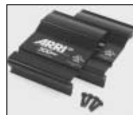
L4.79247UE Set of side panels (USA) ETL (to ser.no.6330) black Set Seitenbleche (USA) ETL (bis Ser.Nr.6330) schwarz