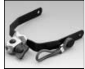
L4.79110.E Stirrup complete Haltebügel komplett